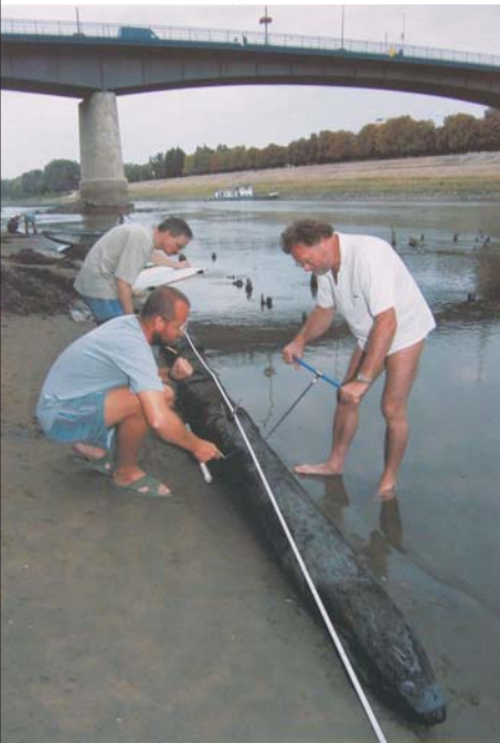
Mintavétel az egyik cölöpből