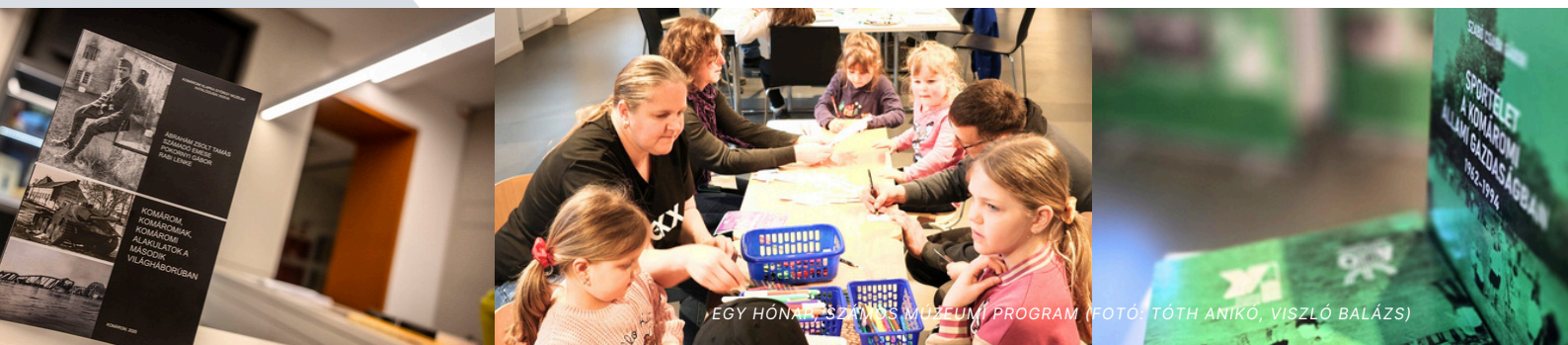
EGY HÓNAP SZÍNŰS MÚZEUMI PROGRAM

Február 21-én az idegenvezetők világnapja alkalmából különleges programokkal várták a családokat. A gyerekek farsangi álarcokat és koronákat készíthettek, mókás játékokban vehettek részt, valamint közösen alkothattak a medve árnyéka-terepasztalon. A kreatív foglalkozások mellett múzeumi kincskeresés, utazás témájú társasjátékok és só-liszt gyurmából készített figurák is színesítették a programot. A látogatók bepillantást nyerhettek a római útépités rejtelseibe is, miközben játékos formában ismerkedtek meg a történelemmel.