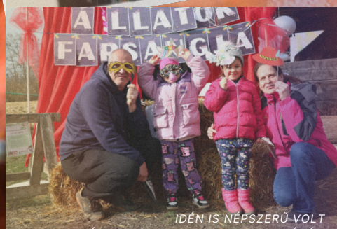
IDÉN IS NÉPSZERŰ VOLT AZ ÁLLATOK FARSANGJA A KEMENCÉNÉLT