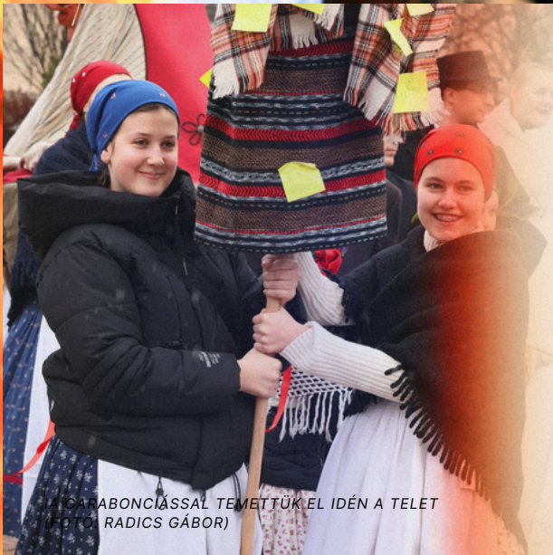
A GARABONCIÁSSAL TEMETTÜK EL IDÉN A TELET

Kiszebáb-égetésse gyerekprogramokkal és farsangi forgataggal búcsúztattuk a telet