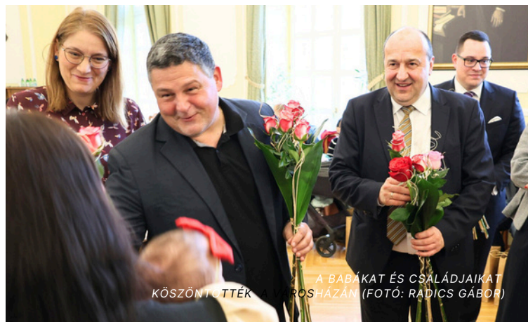
KÖSZÖNTÖTTÉK A BABÁKAT ÉS CSALÁDJAIKAT A VÁROSHÁZÁN

AZ ELMÚLT HETEKEN TÖBB MEGHATÓ ÉS KÖZÖSSÉGFORMÁLÓ ESEMÉNY IS ZAJLOTT, AMELYEK KÖZÖS ÜZENETE AZ ODAFIGYELÉS ÉS AZ ELISMERÉS VOLT. A LEGFIATALABB- AKTÓL AZ IDŐSEBB GENERÁCIÓ TAGJAIG SOKAKAT KÖSZÖNTÖTTEK, HANGSÚLYOZVA, HOGY A KÖZÖSSÉG EREJE AZ EGYMÁS IRÁNTI TISZTELETBEN REJLIK.