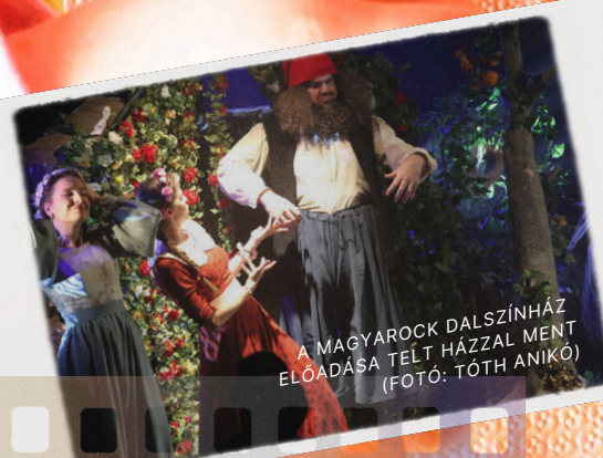
A MAGYAROCK DALSZÍNHÁZ ELŐADÁSA TELT HÁZZAL MENT