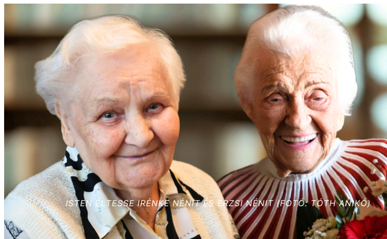
ISTEN ÉLTESSE IRÉNKÉ NÉNIT ÉS ERZSI NÉNIT