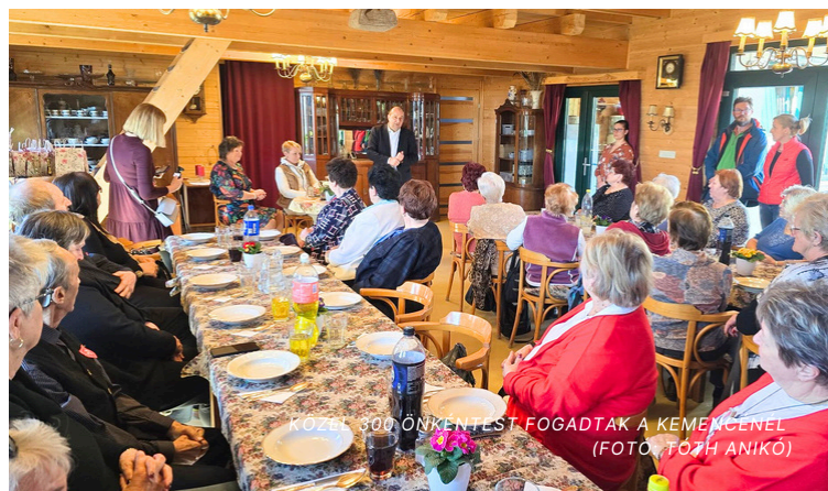
KÖZEL 300 ÖNKÉNTEST FOGADTAK A KEMENCEN