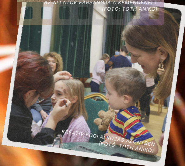
KREATÍV FOGLALKOZÁS SZŐNYBEN