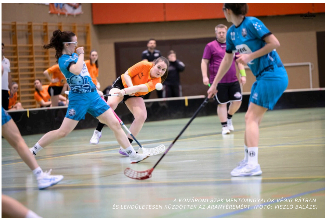
A KOMÁROMI SZPK MENTŐANGYALOK VÉGIG BÁTTRAN ÉS LENDÜLETESEN KÜZDÖTTÉK AZ ARANYÉREMÉRT.

SZÍV, KÜZDELEM ÉS IZGALOM – EZEK JELLEMEZTÉK A KOMÁROMI SZPK MENTŐANGYALOK SZEREPLÉSÉT A BÉCSBEN MEGRENDEZETT IFL 3 NATIONS NEMZETKÖZI FLOORBALLTORNA FINAL FOURJÁBAN. A KOMÁROMI CSAPAT EGÉSZEN A DÖNTŐIG MENETELT, AHOL VÉGÜL EGYETLEN GÓL DÖNTÖTT AZ ARANYÉREM SORSÁRÓL.