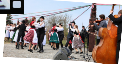
A MÚLT HŐSEI ELŐTT TISZTELEGVE – MÉLTÓSÁGGAL ÉS SZÍVVEL.