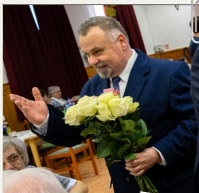
CZITA JÁNOS ALPOLGÁRMESTER KÖSZÖNTI A HÖLGYEKET KOPPÁNMONOSTORON

A nőnap események ismét rámutattak: városunk közösségeiben az egymás iránti tisztelet és megbecsülés továbbra is fontos és élő érték.